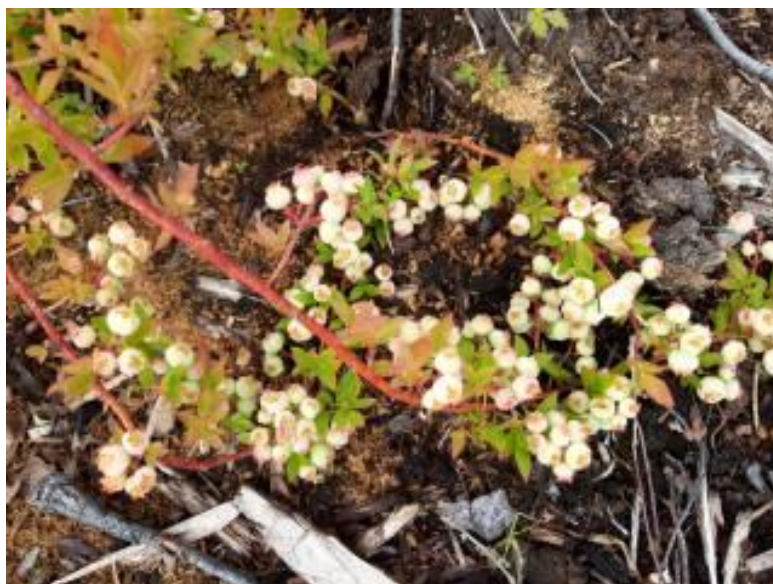
Рисунок 18 – Цветение голубики узколистной отборной формы №2