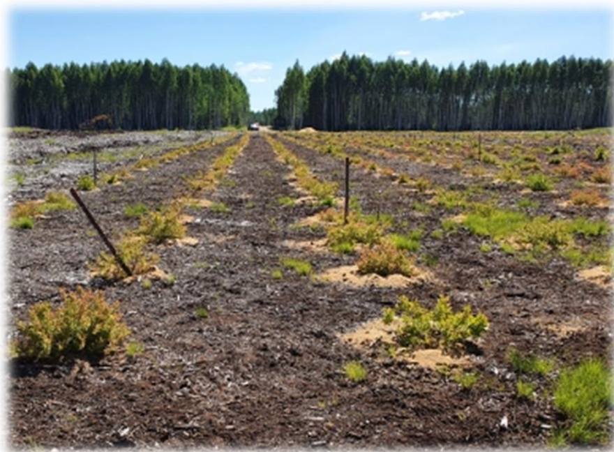
Рисунок 4 – Мульчирование рядов голубики узколистной