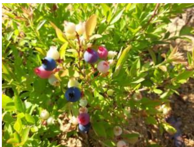
Рисунок 19 – Не полное созревание ягод голубики узколистной отборной формы № 2