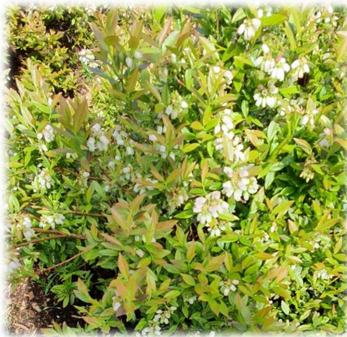
Рисунок 7 – Массовое цветение голубики узколистной