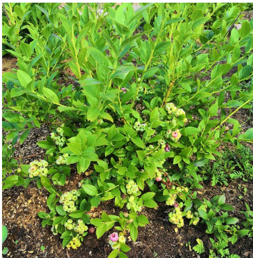
Рисунок 11- Плодоношение голубики узколистной и наклонение ветвей с ягодами к земле