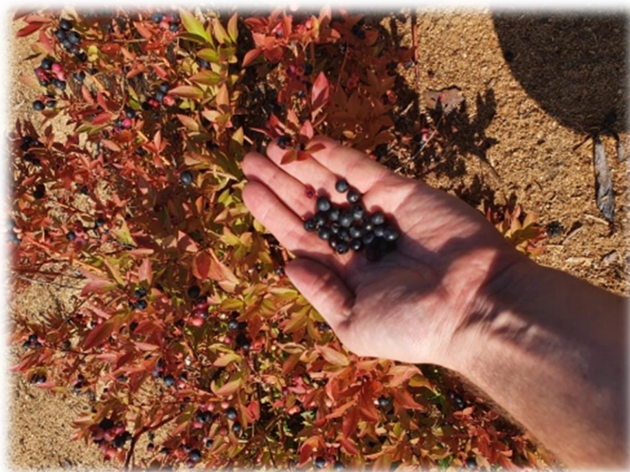
Рисунок 10 – Плодоношения голубики узколистной отборной формы № 2