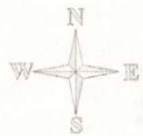
Схема расположения земельного участка, расположенного примерно в 16 м по направлению на юго-запад от ориентира (здание), расположенного за пределами участка, адрес ориентира:

Утверждено постановлением администрации МО "Пинежский район" от _____ № _____